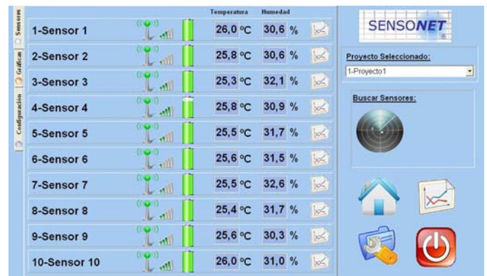
Captura de pantalla de SENSOKIT con ejemplo de proyecto con diez sensores. El nombre de proyecto y el nombre de los sensores se pueden configurar al crear el proyecto en cuestión.

Desarrollamos el producto y lo distribuimos – sin intermediarios – garantizando un excelente servicio postventa.