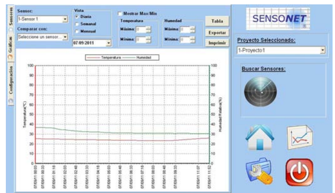
Captura de pantalla de SENSOKIT con ejemplo de gráfica.